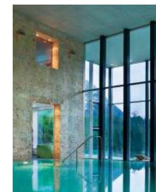
Oben: Warmes Wasser mit Aussicht im Hotel Saratz. Links: Wildnis im Hotelpark.

Phantasie im Massenschlag; die Wanderkarte wird einem an einer Hotelrezeption ausgehändigt, die Sandwiches schmiert das Küchenpersonal, und bei schlechtem Wetter muss man sich keine alternativen Routen ausdenken, sondern nur etwas länger im Spa-Bereich der jeweiligen Herberge ausharren.