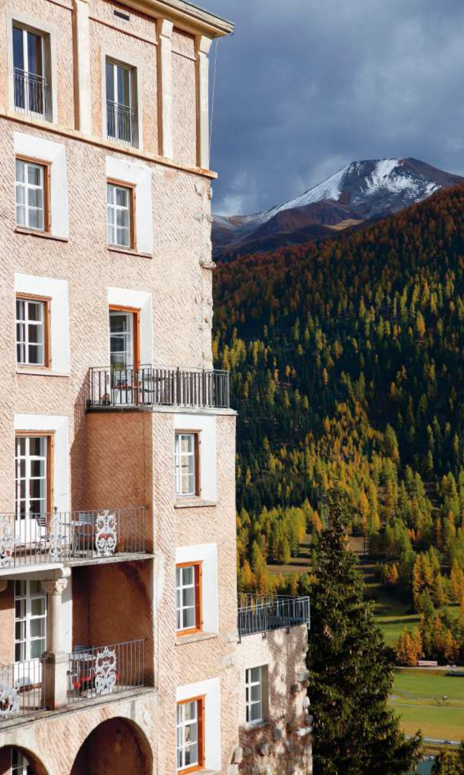
Oben: Der Blick vom Hotel Castell in die Berge. Rechts: Dieser Rohschinken kommt nicht aus dem Rucksack. Ganz rechts: Vom «Sky Space» des Künstlers James Turrell schauen die Hotelgäste in den Himmel.